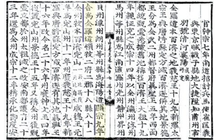
〈고려사〉 지, 지리지 전라도