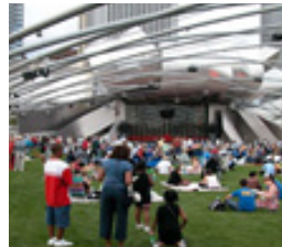
〈제이 프리츠키 파빌리온〉