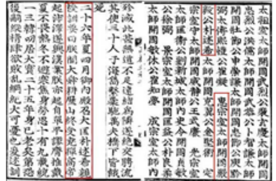
〈훈요십조 중 제8조〉