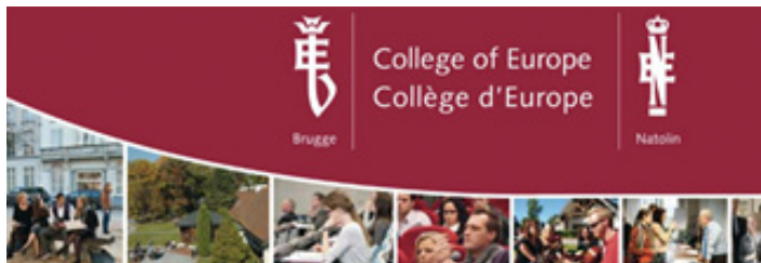
동아시아 칼리지 홈페이지 화면