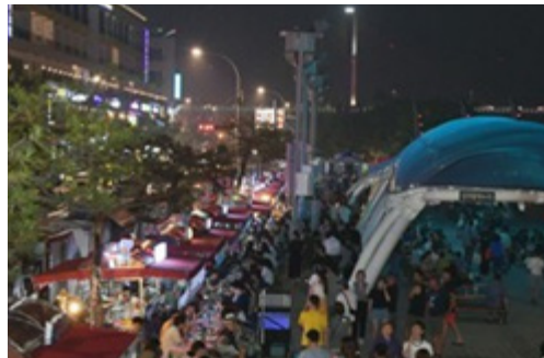
[포장마차가 늘어난 종포해양공원]