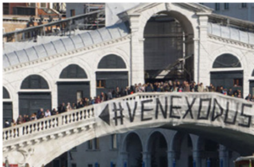
[이탈리아 베니스 리알토 다리 관광객 거부 캠페인]