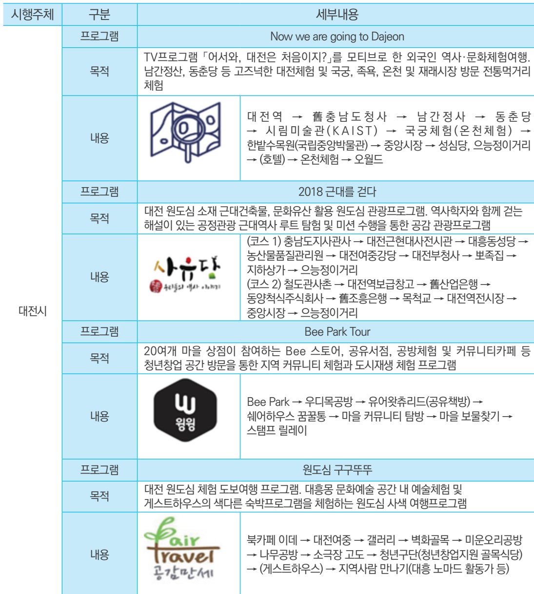
〈표 1〉 지속가능한 관광 관련 공정관광 프로그램

자료 : 대전마케팅공사(2018), http://dcckorea.or.kr:8088/webzine/201808/subpages/plus01.html , 대전마케팅공사 공식 블로그