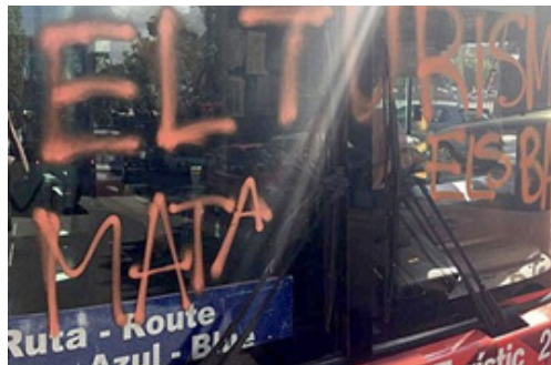
[스페인 바르셀로나 관광버스 공격사태]