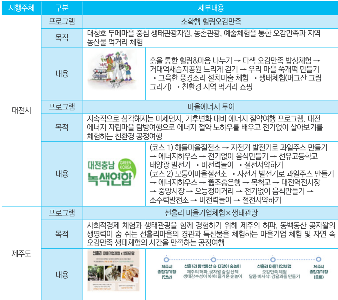
〈표 2〉 녹색관광 관련 공정관광 프로그램

자료 : 대전마케팅공사(2018), http://dockorea.or.kr:8088/webzine/201808/subpages/plus01.html , 대전마케팅공사 공식 블로그 자료 : 제주생태관광지원센터(2018), http://www.jeuu.go.kr/ecotour/index.htm