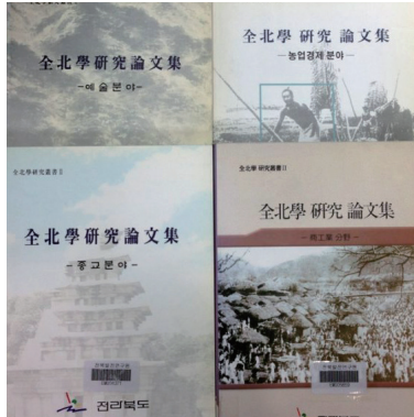
〈1997년에 시작된 '전북학연구' 결과물〉