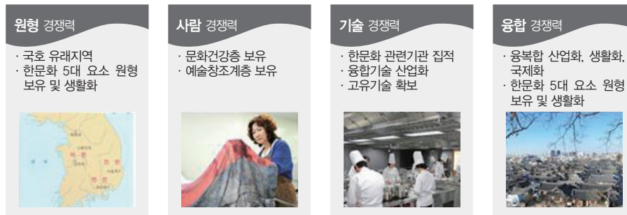
〈그림 2〉 한문화창조산업에 대한 전북의 경쟁력

*참조: 이상열(2014), “한문화창조산업의 개념과 전북의 전략”, 『2014 전라북도한문화창조산업 국제컨퍼런스』