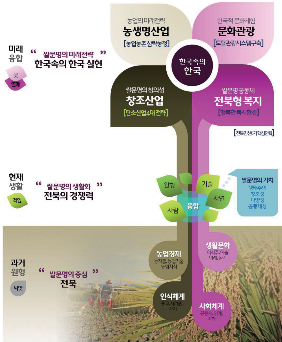
<그림 1> '한국 속의 한국' 과 민선6기 핵심전략 개념도