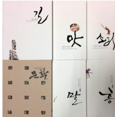
〈2008년부터 시작된 '전북의 재발견'〉